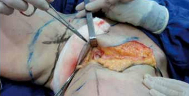
Figura 8 – Detalhe intra-operatório da primeira ancoragem.