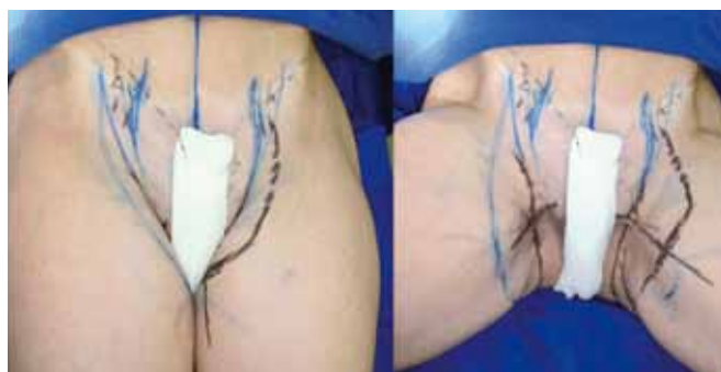
Figura 4 – Marcação na região da virilha, estendendo-se desde a raiz da coxa.