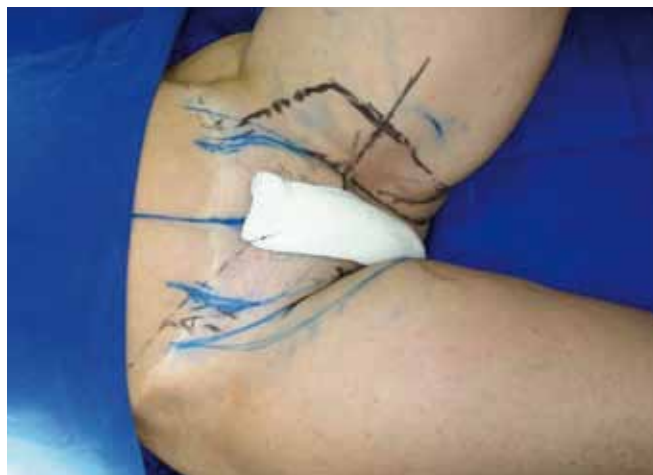
Figura 5 – Posição cirúrgica.