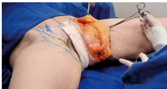
Figura 6 – Detalhe do descolamento do retalho