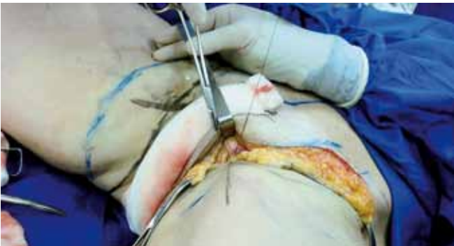
Figura 9 – Detalhe intra-operatório da primeira ancoragem.