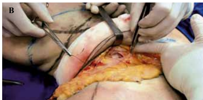
Figura 7 – Detalhe intra-operatório da dissecação do tendão do músculo adutor longo.