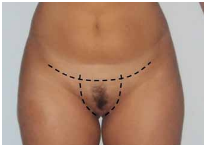
Figura 3 – Marcação na região da virilha.

• Lipoaspiração: Quando necessária, a lipoaspiração é realizada como primeiro passo. Após infiltração de solução de Klein, lipoaspiramos a camada profunda próxima à