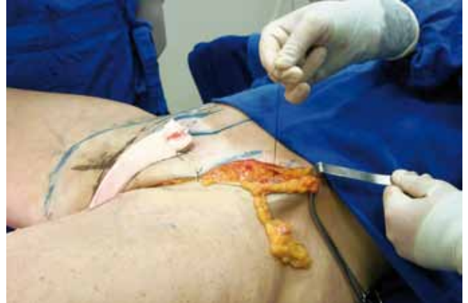
Figura 12 – Detalhe intra-operatório da segunda ancoragem.