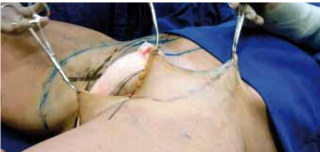
Figura 10 – Detalhe intra-operatório do tratamento do retalho de pele.