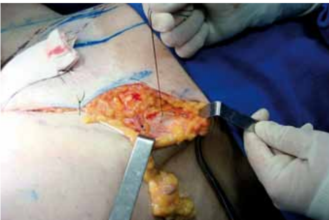
Figura 11 – Detalhe intra-operatório da segunda ancoragem.