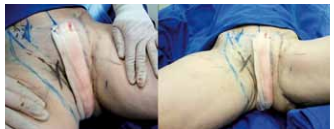
Figura 14 – Aspecto comparativo da cirurgia finalizada em membro inferior esquerdo.