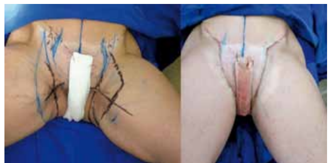
Figura 15 – Aspecto comparativo da cirurgia finalizada em membro inferior esquerdo.